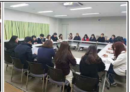
국가 교육근로장학생 간담회