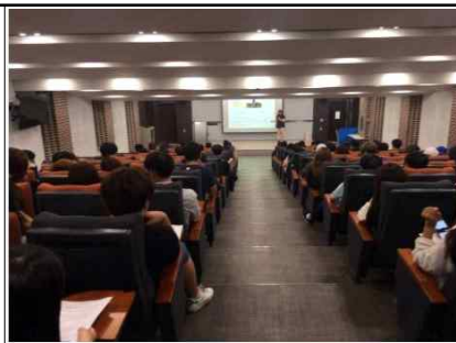
안전사고 예방 교육